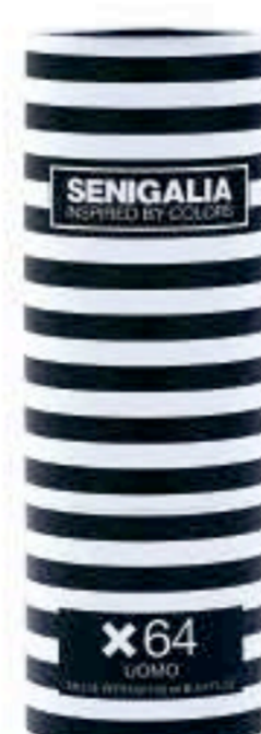
UOMO X64 INVICTUS Madera + Acuatico Pomelo, Pachulí, Notas Ambarinas.