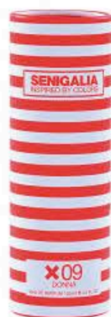
DONNA X09 FLOWERS Floral Grosella, Rosa, Violeta, Vainilla.