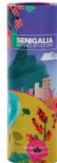
DONNA X99 PURE XS

Oriental + Floral Miel, Citricos, Nardo, Pachuli, Sandaló.