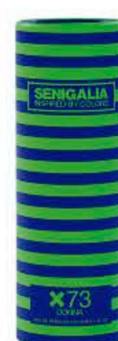
DONNA X73 LA VIE EST BELLE Oriental + Floral Pera, Azahar, Jazmín, Vainilla, Pachuli.