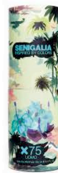
UOMO X75 INVICTUS INTENSE

Oriental + Madera Canela, Notas Frutales, Azafrán, Ciprés, Cuero.