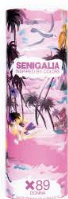
DONNA X89 OLYMPEA INTENSE

Floral + Madera Red fruits, Peonía, Notas florales, Jazmín.