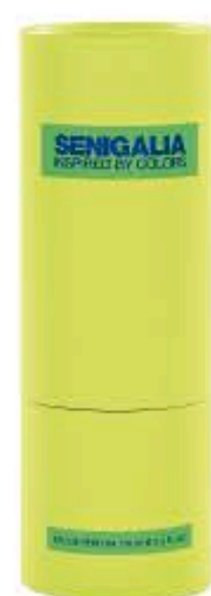
UOMO X77 Bad Boy

Floral + Frutal Frambuesa, Bergamota, Rosa, Dulces, Iris, Pachulí.