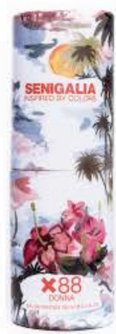
DONNA X88 WORD

Floral + Madera Red fruits, Peonía, Notas florales, Jazmín.