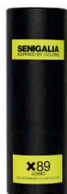
UOMO X89 212 MEN HEROES

Fougere + Frutal Jengibre, Pera, Salvia, Cuero, Lavanda, Geranio.