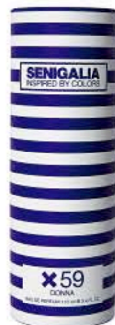
DONNA X59 LADY MILLON Floral + Madera Jazmin, Vetiver, Vainilla.