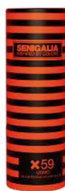
UOMO X59 212 VIP Oriental + Madera Lima, Menta, Vodka, Manzana, Madera.