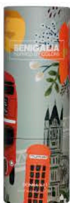
DONNA X115 MY WAY

Oriental + Floral Bergamota, Jazmin, Frambuesa, Pachuli.