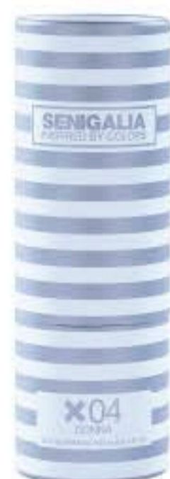
DONNA X04 C.H. 212 Floral + Frutal Bergamota, Camelia, Almizcle.