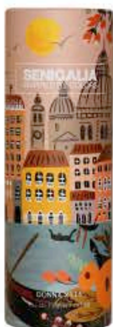
DONNA X116 SO SCANDAL

Floral Bergamota, Nardos, Jazmín, Vainilla.