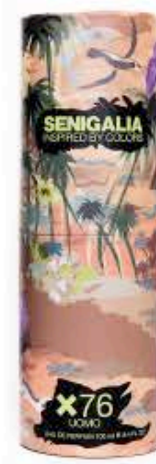
UOMO X76 PURE XS

Madera + Acuático Madera, Laurel, Azahar, Whisky.