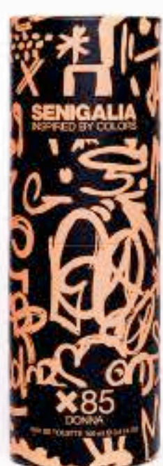
DONNA X85 LADY MILLON PRIVE

Oriental + Floral Notas amaderadas Vainilla, Miel.