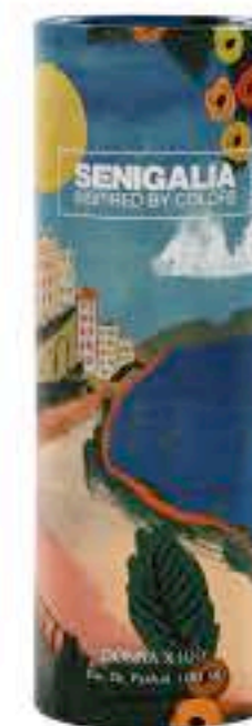
DONNA X100 LA VIE EST BELLE INTENSEMENT

Floral + Oriental Vainilla, Almizcle, Durazno, Sandalo, Coco, Azahar.