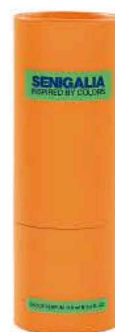
UOMO X78 212 Vip Black Extra

Oriental + Especiadao Pimienta, Bergamota, Haba Tonka, Cacao.