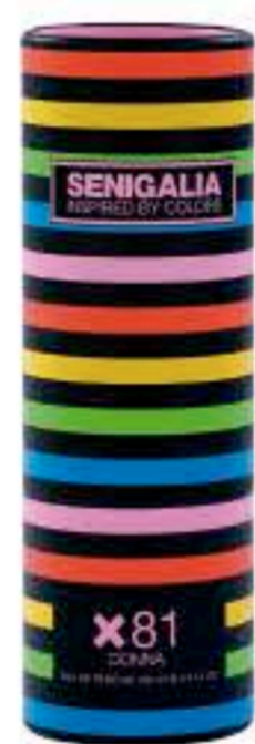
DONNA X81 OLYMPEA Oriental + Floral Mandarina, Vainilla, Sándalo.