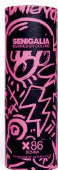
DONNA X86 212 WILL PARTY

Oriental + Floral Notas amaderadas Vainilla, Miel.