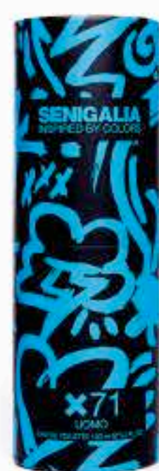
UOMO X71 INVICTUS AQUA

Madera + Acuático Pimienta, Violeta, Ámbar.