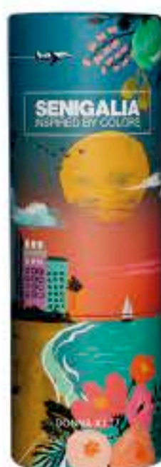
DONNA X117 VERY GOOD GIRL

Floral + Frutal Flor de naranjo, Jazmín y Tuberosa.