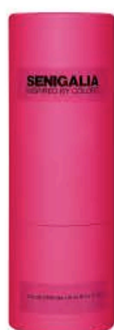
DONNA X125 OLIMPEA SOLAR

Almizcle + Floral Mango, Bergamota, Jazmín, Incienso, Vainilla, Sándalo.