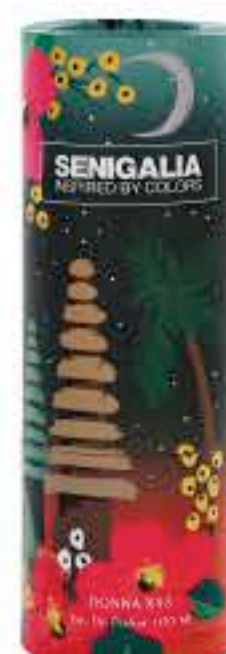
DONNA X98 SCANDAL BY NIGHT

Oriental + Gourmand Pera, Vetiver, Vainilla.