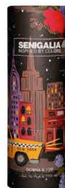
DONNA X120 212 HEROES

Ámbar + Fougère Lavanda, Mandarina, Jazmín y Vainilla.