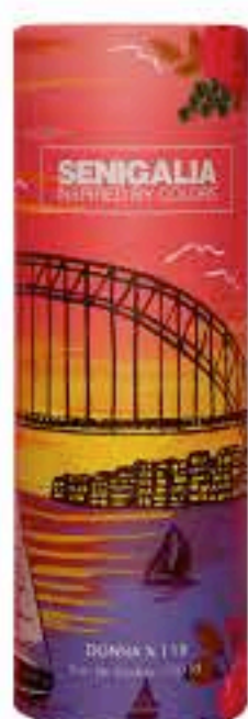
DONNA X118 LADY M. FABULOUS

Floral + Frutal Lichi, Grosella roja, Rosa, Vainilla y Vetiver.