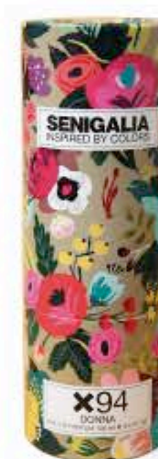
DONNA X94 SCANDAL JPG

Oriental + Floral Limón, Canela, Jazmín sambac Praliné, Almizcle.