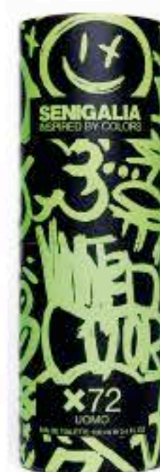
UOMO X72 FIERCE

Madera + Acuático Pimienta, Violeta, Ámbar.