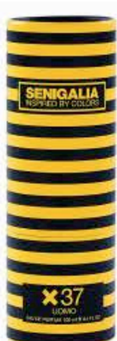
UOMO X37 1 MILLON Madera + Especiadao Mandarina, Pomelo, Pachuli.