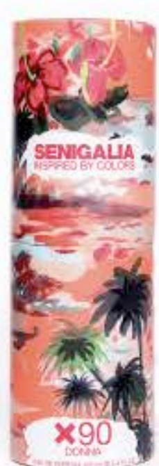
DONNA X90 CH PRIVE

Floral + Oriental Vainilla, Azahar, Pomelo, Cedro, Sal, Vainilla.