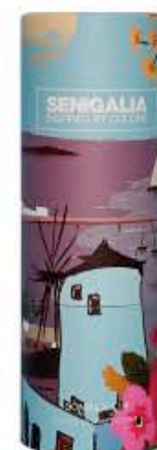
DONNA X119 LIBRE YSL

Floral + Oriental Rosa, Mandarina, Nardos, Jazmín, Vainilla.