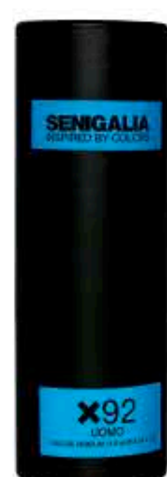
UOMO X92 KENZO H. INTENSE

Madera + Oriental Salvia esclarea, Caramelo, Vetiver.