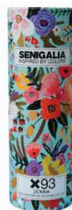
DONNA X93 GOOD GIRL LÉGÈRE

Oriental + Floral Flor de Azahar, Esencia de Bergamota, Flores Blancas.