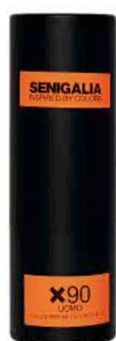
UOMO X90 PHANTOM

Fougere + Frutal Jengibre, Pera, Salvia, Cuero, Lavanda, Geranio.