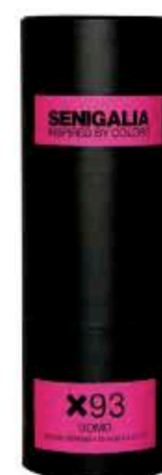
UOMO X93 SAUVAGE ELIXIR

Madera + Acuatico Pimienta Rosa, Vetiver, Sándalo, Pachuli.