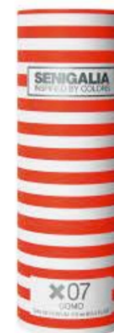
UOMO X07 212 MEN Chipre + Fresco Lavanda, Gardenia, Sándalo, Jengibre.