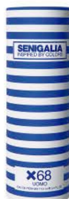
UOMO X68 SAUVAGE Aromatico + Fougere Arandano, Toronja, Cafe, Lavanda.