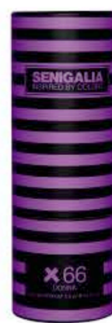
DONNA X66 212 VIP Oriental + Madera Ron, Gardenia, Vainilla, Almizcle.