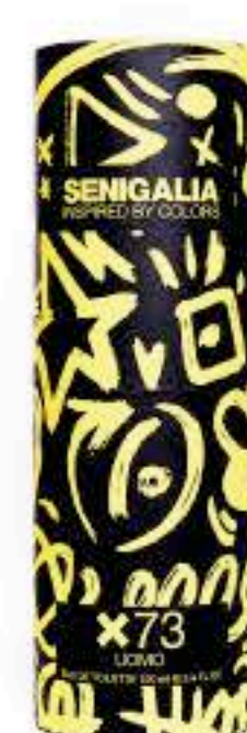
UOMO X73 1 MILLON PRIVE

Madera + Aromático Limón, Jazmín, Vetiver.