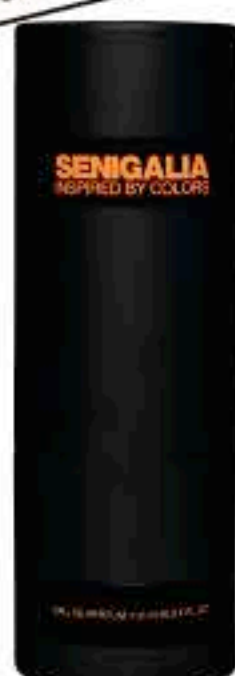
UOMO X99 1 MILLION ROYAL

Aromatico Amaderado Mandarina, Bergamota, Lavanda, Salvia, Cedro, Pachuli.