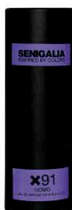
UOMO X91 SCANDAL

Madera + Especiadao Lavanda, Limon, Manzana, Pachuli, Vetiver.