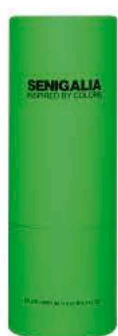
DONNA X126 OUI LA VIE EST BELLE

Citrica + Aromática Naranja, Mandarina, Notas solares, Flores blancas.