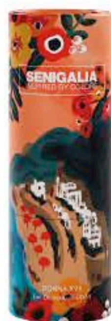
DONNA X96 IDOLE

Floral + Amaderado Bergamota, Pera, Nardos, Jazmin, Vainilla, Pachuli.