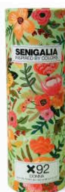
DONNA X92 LA VIE EST BELLE L'ÉCLAT

Floral + Acuático Flor de limón, Clementina, Notas solares, Vainilla, Cachemira.