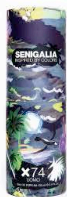
UOMO X74 XS L'APHRODISIAQUE

Cuero Osmanthus, Caviar de vainilla, Pachulí, Cuero rojo.