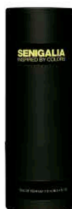
UOMO X98 ONE MILLION ELIXIR

Madera + Aromatico Toronja, Absenta, Menta, Lavanda, Ciprés, Pachulí.