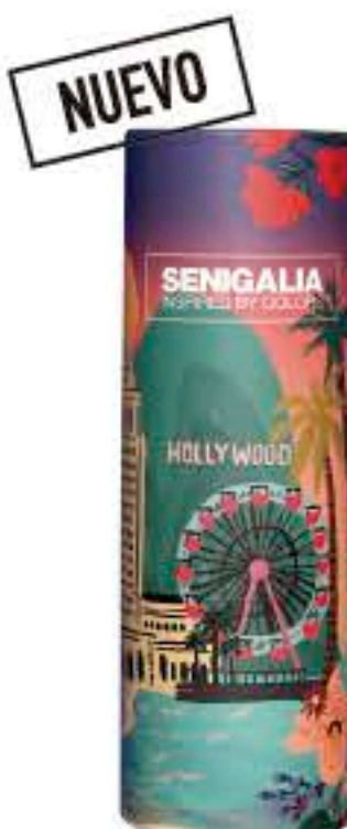
DONNA X128 SCANDAL LE PARFUM

Floral + Frutal Frambuesa, Sándalo Flor de azahar.