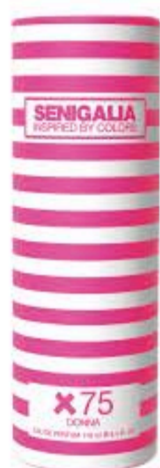
DONNA X75 212 VIP ROSE Chipre + Frutal Durazno, Almizcle, Notas Amaderadas.