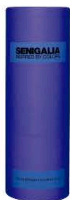
DONNA X124 FAME

Almizcle + Floral Mango, Bergamota, Jazmín, Incienso, Vainilla, Sándalo.