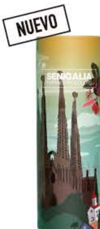
DONNA X130 GOOD GIRL BLUSH

Floral Grosellas Negras, Rosa, Peonia, Vainilla, Pachuli.