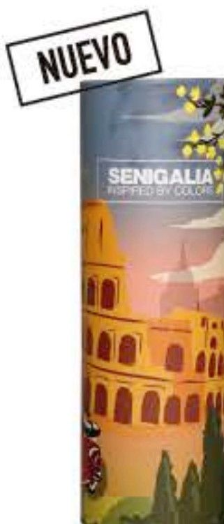
DONNA X129 OLYMPÉA FLORA

Gourmand + Chipre Jazmin, Caramelo, Vainilla.