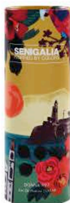
DONNA X97 LA BELLE

Floral + Chipre Pera, Rosa Jazmin, Vainilla, Almizcle.