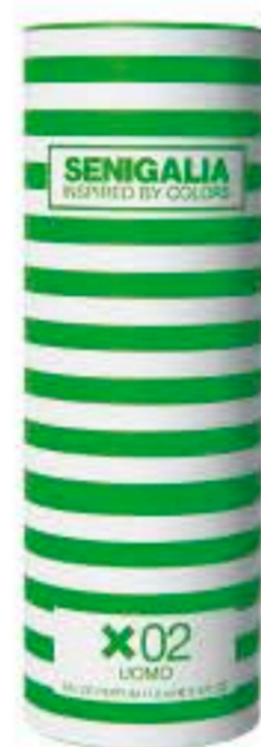
UOMO X02 L'EAU D'ISSEY Chipre + Fresco Bergamota, Limon, Nuez Moscada.