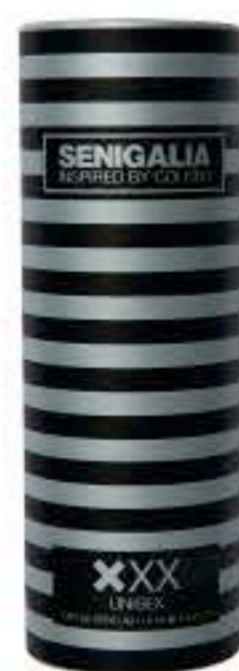
XXX ONE Chipre + Fresco Limon, Iris, Madera de Cedro.