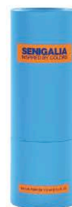
UOMO X79 Le Beau JPG

Madera + Especiadao Ron, Coca Cola, Pomelo, Lavanda, Cuero, Musgo.