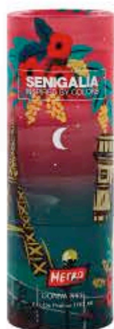
DONNA X95 L'INTERDIT

Floral + Amaderado Bergamota, Pera, Nardos, Jazmin, Vainilla, Pachuli.