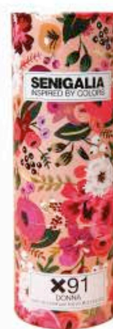
DONNA X91 OLYMPÉA ACQUA EDP LÉGÈRE

Floral + Acuático Flor de limón, Clementina, Notas solares, Vainilla, Cachemira.