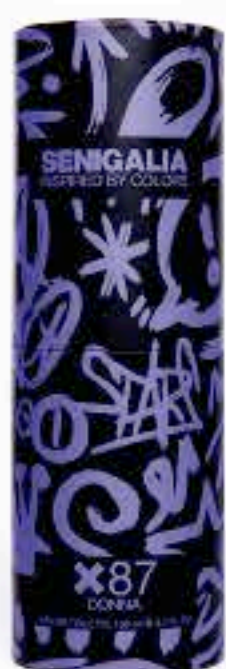
DONNA X87 GOOD GIRL