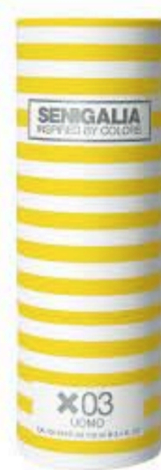
UOMO X03 KENZO POUR HOMME Chipre + Fresco Lima, Menta, Almizcle, Pimienta.