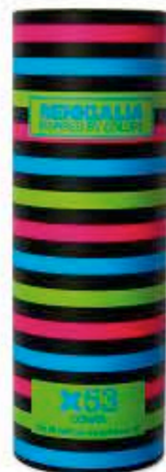
DONNA X53 ANGEL DEMON LE SECRET Floral + Frutal Limon, Arandano, Jazmín, Pachuli.